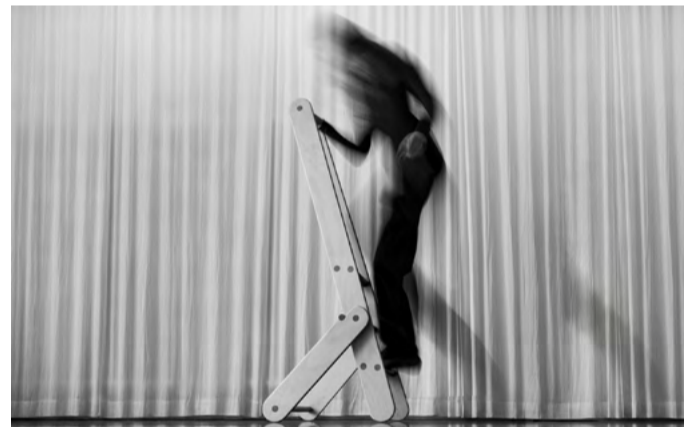
Trittleiter »Tudo« von Nele Seyfarth aus dem Projekt »Skala«