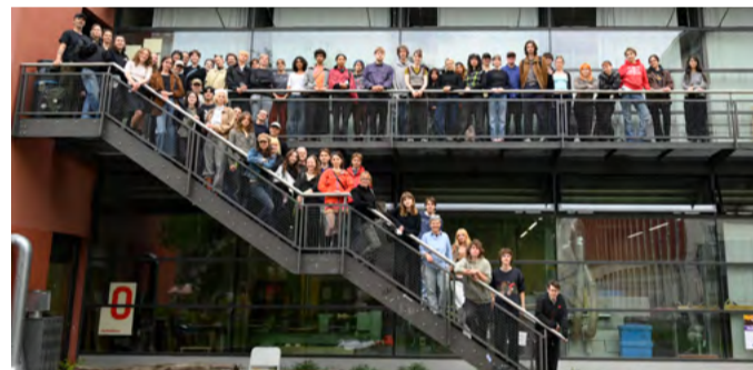
Grundlagen-Jahrgang 2025/26

Studentische Führungen: Sa./So., 13 Uhr | So., 15 Uhr Treffpunkt: Haus H (EG, vor der Holzwerkstatt, H 0.02)