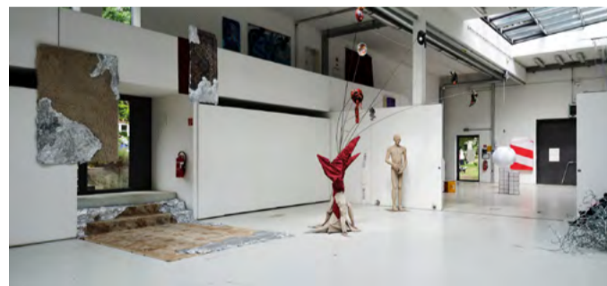
Halle der Bildhauerei, Rundgang 2025, Foto: © Andreas Rost

Studentische Führungen: Sa./So., 14 und 16 Uhr Treffpunkt: vor Haus E