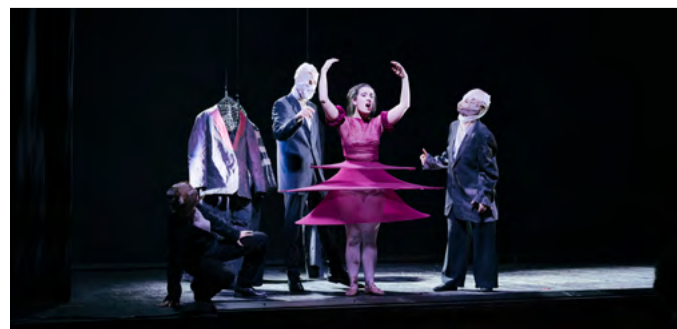
Musiktheaterwerkstatt »Agrippina«, Wintersemester 2025/26, Foto: © Tabita Hub

Studentische Führungen: Sa./So., 14 und 16 Uhr Treffpunkt: Kunsthalle am Hamburger Platz