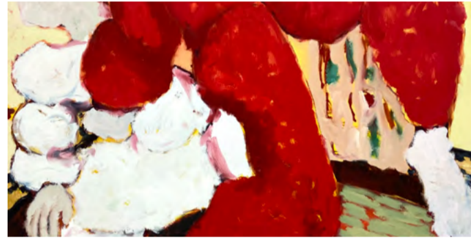
»Mother and Child«, Arbeit von Maxi Thom, Foto: © Maxi Thom

Studentische Führungen: Sa./So., 15 Uhr Treffpunkt: vor Haus M