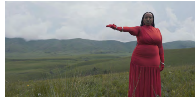
»The Fire Last Time«, Filmprojekt von Kathleen Boman, Foto: © Kathleen Boman

Studentische Führungen: Sa./So., 15 Uhr (deutsch) und 16 Uhr (englisch) Treffpunkt: Haus T, Haupteingang (EG)