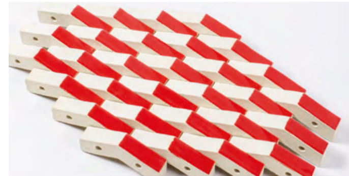
»From Patterns to Structures. Hybrid Craft. Basketry between the Analog and the Digital.«, Semesterprojekt von Kenny G. Valdes, 2025/26, Foto: © Kenny G. Valdes

Studentische Führungen: Sa./So., 13 und 16 Uhr Treffpunkt: Haus A (2. OG, vor Raum A 2.01)