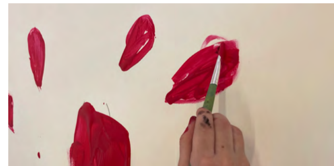
Ein Kind malt einen Vulkan in der Kunsttherapie