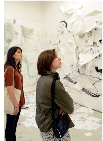
Rundgang 2015

Impressum: weißensee kunsthochschule berlin, Referat für Öffentlichkeitsarbeit, Birgit Fleischmann, Bühningstraße 20, 13086 Berlin, Tel.030-47705-222 Fax:030-47705-291, E-Mail: presse@kh-berlin.de