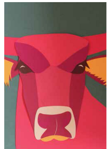
Arbeit von Maxie Heiner

weißensee kunsthochschule berlin, Referat für Öffentlichkeitsarbeit, Birgit Fleischmann, Bühningstraße 20, 13086 Berlin, Tel.030-47705-222 Fax:030-47705-291, E-Mail: presse@kh-berlin.de