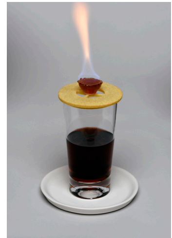
„Feuerzangenbowle“ von Katharina Stärck

weißensee kunsthochschule berlin, Referat für Öffentlichkeitsarbeit, Birgit Fleischmann, Bühningstraße 20, 13086 Berlin, Tel.030-47705-222 Fax:030-47705-291, E-Mail: presse@kh-berlin.de