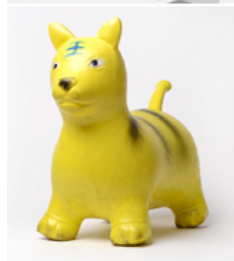
Bilder zu den Arbeiten