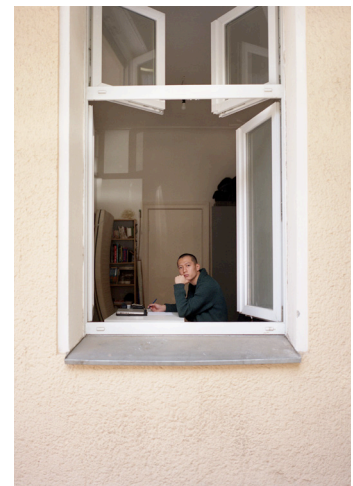
Fotoausschnitt / Rie Yamada