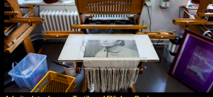
Arbeitsplatz: Joanna, Textil- und Flächen-Design

Textil und Flächen-Design Das Fachgebiet Textil- und Flächen-Design befasst sich sowohl mit konstruktiv-technischen als auch mit ästhetisch-sinnlichen Aspekten von Flächen. Dabei steht ein erweitertes Material- und Anwendungsspektrum im Blickfeld des Studiums. Die Auseinandersetzung mit benachbarten Disziplinen wie Mode- und Produkt-Design, Architektur und Bildende Kunst spielt hier eine große Rolle. Studierende des Fachgebiets stellen ihre aktuellen Entwurfsprojekte aus dem BA- und MA-Studium aus. → Haus A (2. OG)