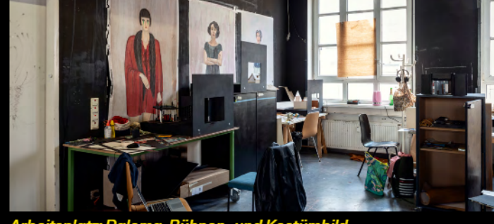
Arbeitsplatz: Paloma, Bühnen- und Kostümbild

Eisler Berlin sind Bühnen- und Kostümbilder zu Aufführungen von „Idomeneo“ und „La Bohème“ entstanden. Gezeigt werden außerdem Entwürfe zu fiktiven Inszenierungen von Texten der Autorinnen Elfriede Jelinek und Else Lasker-Schüler sowie Aufführungskonzepte zum „Frankenstein“-Stoff, die in Kooperation mit der Hochschule für Schauspielkunst Ernst-Busch erarbeitet wurden. Außerdem werden Arbeiten aus dem 2. Studienjahr sowie Diplome und Arbeiten der Meister-schüler_innen zu sehen sein. → Haus T, Aufgang C/D (2. OG) und Kunsthalle am Hamburger Platz