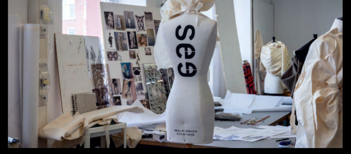
Arbeitsplatz: Helena, Mode-Design

Mode-Design Der Bachelor- und Master-Studiengang Mode-Design zeigt ausgewählte studentische Arbeiten des Wintersemesters 2021/22 sowie des Sommersemesters 2022 in den Räumen C2.03, C2.04 und C2.05. Fashion-Filme im Hörsaal C1.05 sowie Runway-Fotografien im Flur des Fachgebiets Mode-Design präsentieren die Bachelor- und Master-Abschluss-Kollektionen aus den Jahren 2021 und 2022. → Haus C (2. OG)